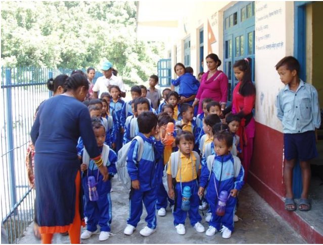
Die Schule in Bhaise.