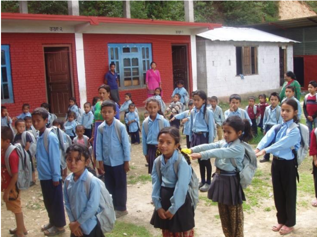
Die Schule in Irkhu.

Im nächsten Jahr wird das Projekt NEPALKIDS 15 Jahre alt. Ihr könnt euch vorstellen, dass wir uns dafür etwas einfallen lassen. Die Reise steht selbstverständlich auch ganz im Zeichen dieses Jubiläums. Wenn man bedenkt mit welch bescheidenen Mitteln, aber umso mehr Engagement wir damals angefangen haben. Und dann blickt man auf anderthalb Jahrzehnte zurück.