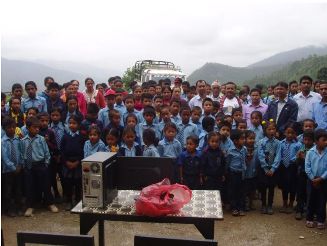
PC-Übergabe in Kadambas.

Die Nepalkids haben sich jetzt mit dem Kauf von fünf PC's für die Ausstattung eines IT-Schulungsraums beteiligt. Mittlerweile ist das jahrelange Problem mit den temporären Stromausfällen behoben.